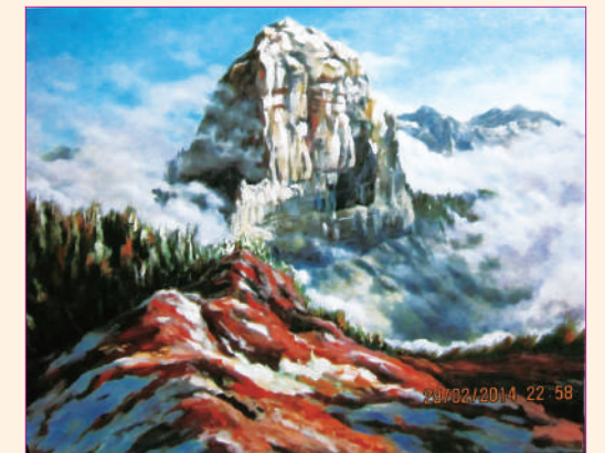
作者為感懷母親恩德所做之油畫作品-大霸尖山

「可以自己決定」是人人面對自己生命最後的尊嚴，一般家屬與病人本身在心理上也許都會害怕，擔心知道疾病真實的狀況，但是，我的母親卻選擇勇敢面對，她想在知道後由自己做決定，對侵入性醫療及後續可能帶來的身心影響，她的決定是不希望沒有品質地活著，即便放棄醫療後腦瘤將帶來身體健康上的變化與承受，她仍選擇自己必須知情。