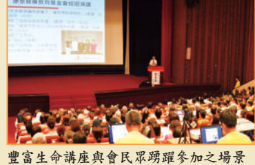
豐富生命講座與會員踴躍參加之場景