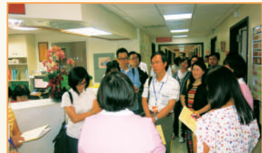
司法院各級庭長、法官等一行人參訪大德病房