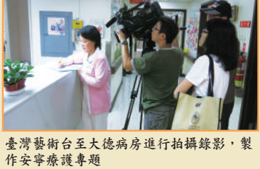
臺灣藝術台至大德病房進行拍攝錄影，製作安寧療護專題