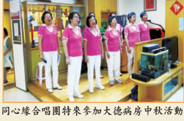
同心緣合唱團特來參加大德病房中秋活動