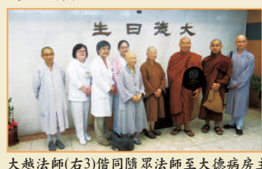
大德法師(右3)偕同隨眾法師至大德病房主講於會後與同仁合影