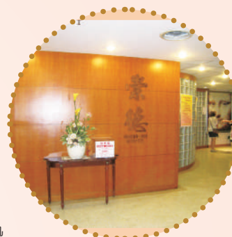
高雄榮總崇德安寧病房入口

以「高質服務、雄心創新、榮耀生命、總歸愛心」為核心價值的高雄榮民總醫院，秉持對各階段疾病患者一致的優質療護理念，在民國87年開始安寧居家與安寧住院療護服務，持續關心癌症末期病人的醫療照顧與生活品質，成為高屏地區第一家開辦安寧病房的醫學中心。目前病房容量達20床，為南部地區病床數最多的安寧病房。民國94年起，高榮配合國民健康局癌症診療品質提升計畫辦理「安寧共同照顧」，將安寧緩和醫療的五全照顧模式延展至一般病房的癌末病人照顧，希望能夠在末期病人有限存活期內，盡可能減緩其身、心、靈痛苦，使其與家人正向面對生命限度，以達到「生死兩相安」的理想。