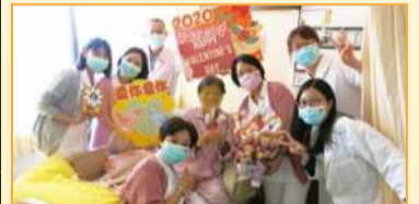
大德病房醫護團隊於情人節向病人慰問致意