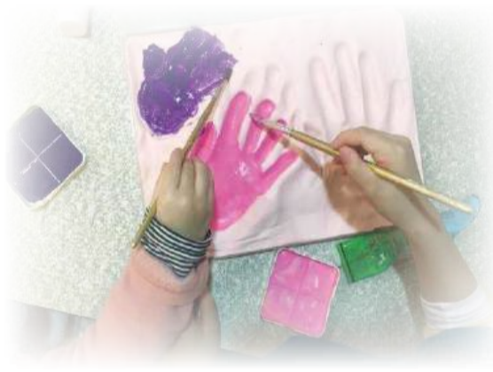
大德基金會提供相關材料，供護理師們協同病人家屬合力製作臨終病人手模留念

PS.大德基金會另有補助安寧療護業務推展及辦理臺北榮總醫院內外安寧療護團隊工作人員教育訓練等活動之相關內容不在此報告，可參閱大德基金會網頁內容。