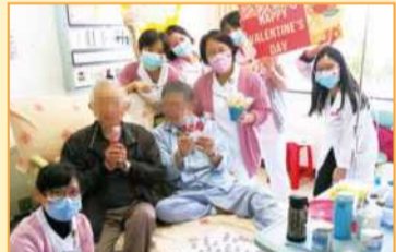
大德病房醫護團隊於情人節向病人及家屬慰問致意