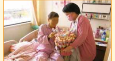
大德病房護理長(右)於情人節向病人慰問致意