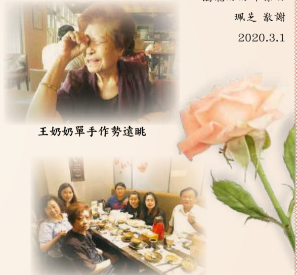
王奶奶單手作勢遠眺