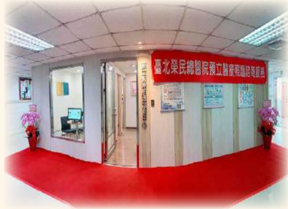
臺北榮總「預立醫療照護諮商中心」正式啟用

最後，回到這篇心得一開始就提問的答案，是因為四十五年前我在北榮出生，曾是北榮寶實，我就因此回來這裡學習死亡嗎？當然不是！但不可否認「萬事都互相效力」，日本文學家村上春樹曾說「死不是生的對極形式、而是以生的一部份存在著。」安寧緩和醫療不僅是臨終、生命末期、緩和而已，這是必修，得以據此成為磐石基礎，是我們從事臨床醫療生涯，一定要有的生生世世的照顧觀念！