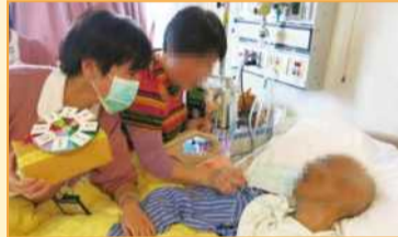
大德病房護理師於情人節向病人及家屬慰問致意