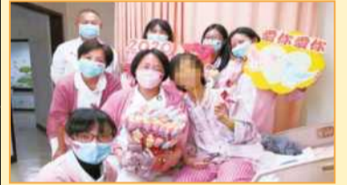
大德病房醫護團隊於情人節向病人慰問致意